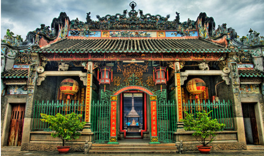
Chùa Bà Thiên Hậu (The Pagoda of the Lady Thien Hau)

Väl åter i Saigon hinner vi med ett stopp vid Ba Thien Hau Pagodan. Den byggdes år 1760 av kineser som kommit från Kwang Shieng i Kina och tillägnades då till minnet av Lady Thien Hau som levde under Song dynastin (960-1279). Lady Thien Hau ansågs ha en speciell förmåga att förutspå sjöväder och under 1800-talet när många kineser under hennes beskydd sjövägen emigrerade till Vietnam ansåg man henne vara deras 'Goddess of the Sea'. Lady Hau var även beskyddare av alla fartyg på haven.